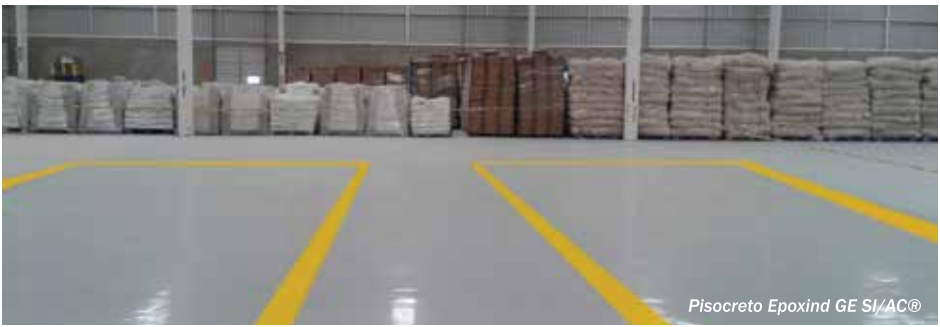
Pisocreto Epoxind GE SI/AC®

Protection® por Curacreto® son pisos epóxicos. Son fabricados sin agregados o pueden tener agregados minerales a base de Arena Silica o agregados a base de Granalla de Acero.