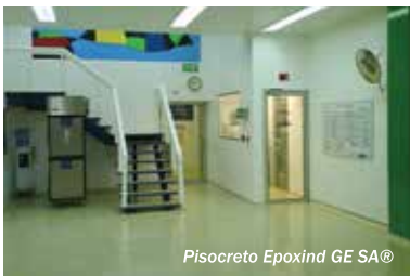
Pisocreto Epoxind GE SA®

*Consultar con nuestro Departamento Técnico las resistencias acuerdo a su proyecto en específico.